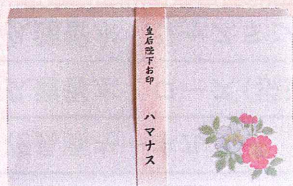
皇后陛下のお印 お印懐紙 ハマナス