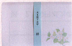
天皇陛下のお印 お印懐紙 梓