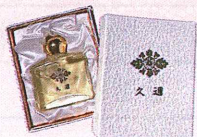
永遠の香り久邇 各3,000円(税込み)

高貴で優雅な九重の奥に、 秘められた香りを 大切に守り続ける心を 今なお保つ逸品です。